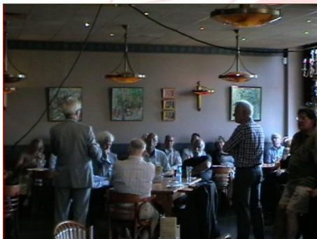
Debat in het Arsenaltheater